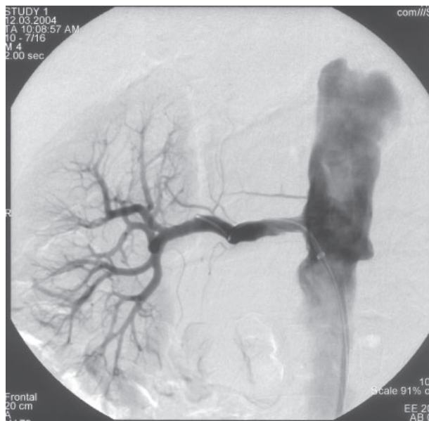
Fig. 2 – Arteriografia renal após colocação de stent na artéria renal direita, com recuperação total do lúmen do vaso.

Na consulta de 12 de Julho de 2004 apresentava elevação dos valores tensionais, pelo que foi efectuado ecodoppler renal que evidenciou reestenose da artéria renal direita. Foi submetido, novamente, a angioplastia e iniciou terapêutica com carvedilol, 25 mg, po, 2 id.